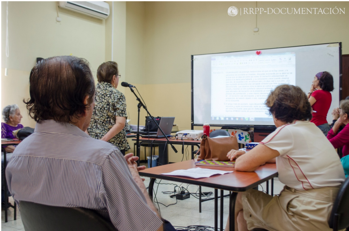
Grabación de los textos del narrador. (Fig. 9)