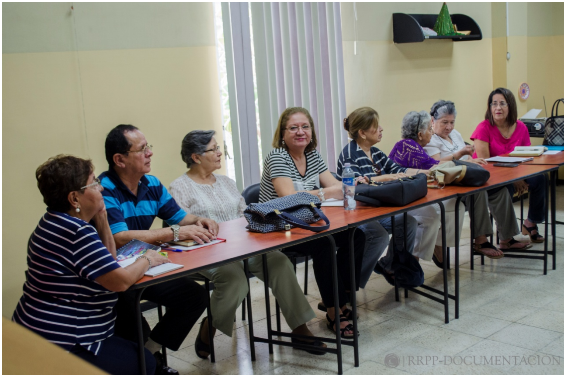
Los participantes listos para el inicio de la clase. (Fig. 7)