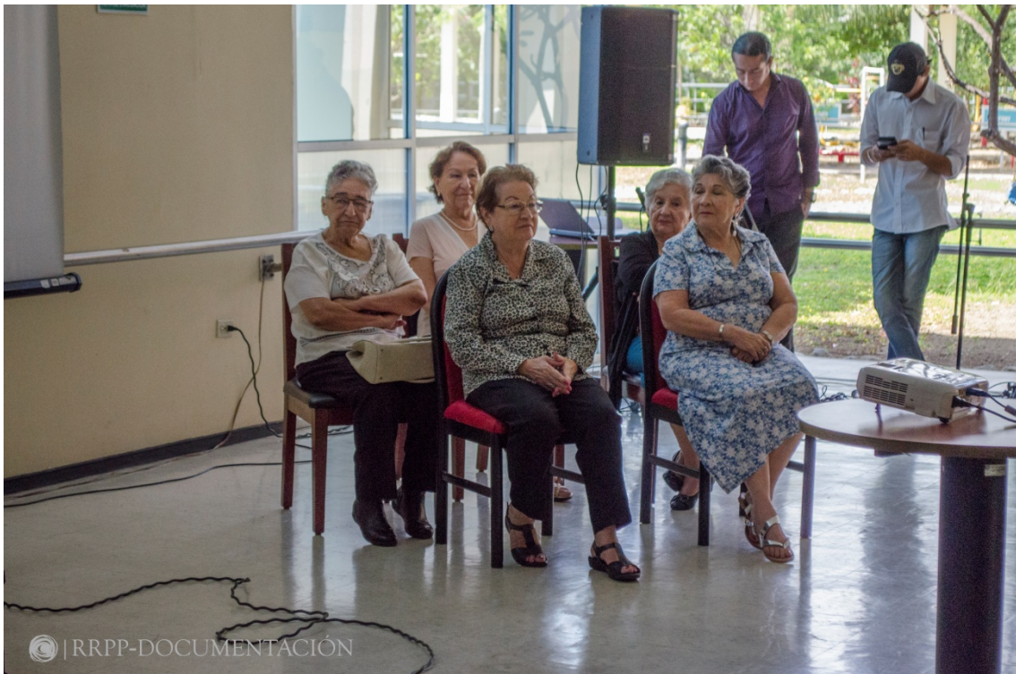
Las participantes listas para contar su experiencia. (Fig. 20)