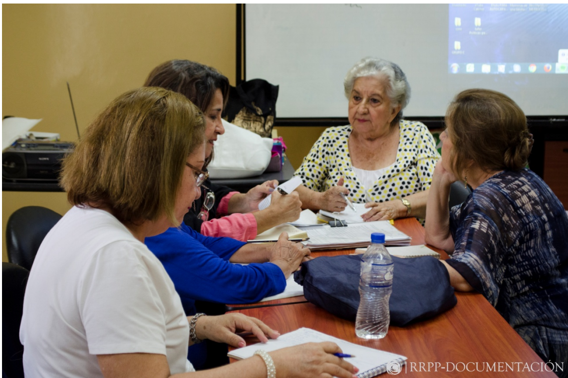
Grupos de trabajo para la estructuración del guión. (Fig. 10)