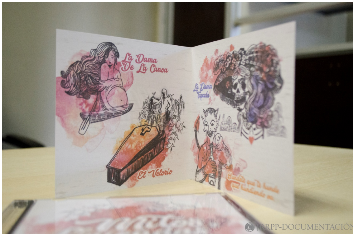
Vistas del diseño del álbum por Sarah Baquerizo. (Fig. 2)