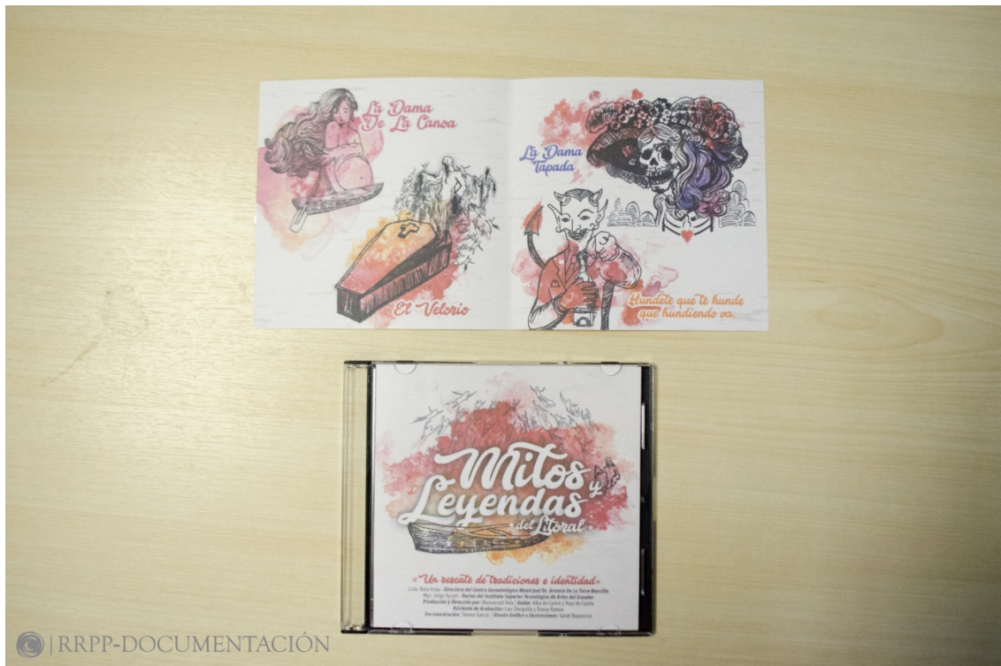
Vistas del diseño del álbum por Sarah Baquerizo. (Fig. 1)