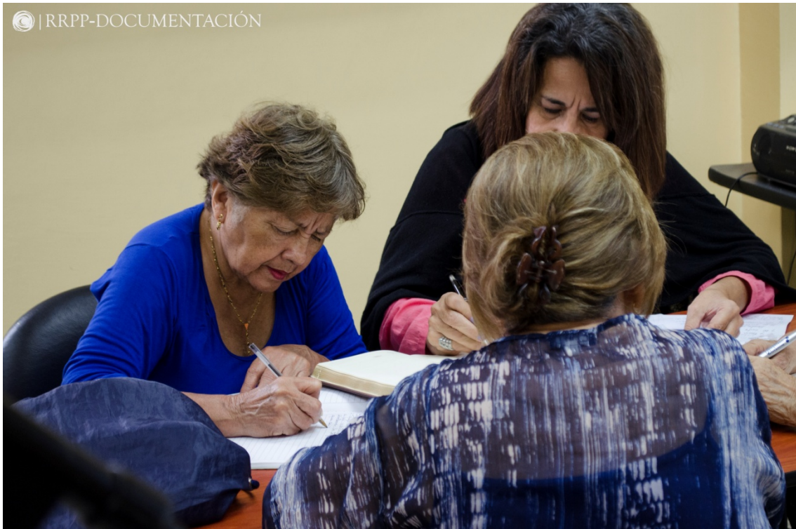
Grupos de trabajo para la estructuración del guión. (Fig. 11)